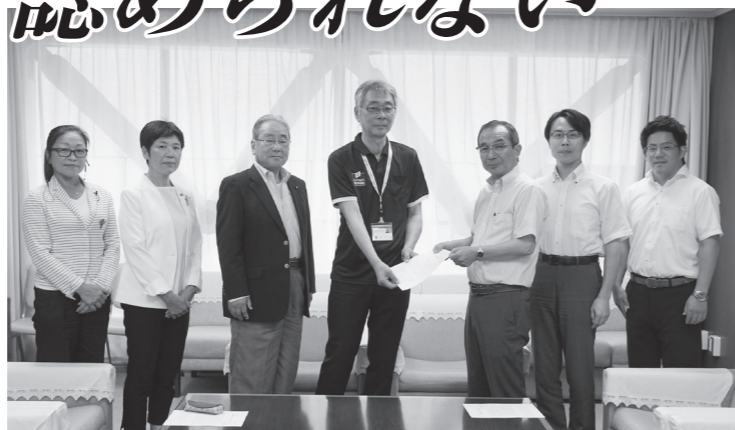
申し入れをする党市議団

その際、市は「きめ細やかな住民説明会の開催および大型機による計画経路の試験運行について議員ご指摘の内容を国に伝えてまいりたい」「教室型の説明会についてもあわせて求めてまいりたい」と答弁しましたが、今