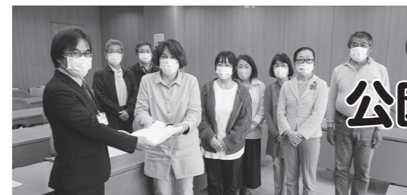
署名提出に同席するとば市議（右から 2 人目）

誰もが当たり前に住みたい場所で暮らしていけるように理解を広げ、市の支援拡充を引き続き求めていきます。