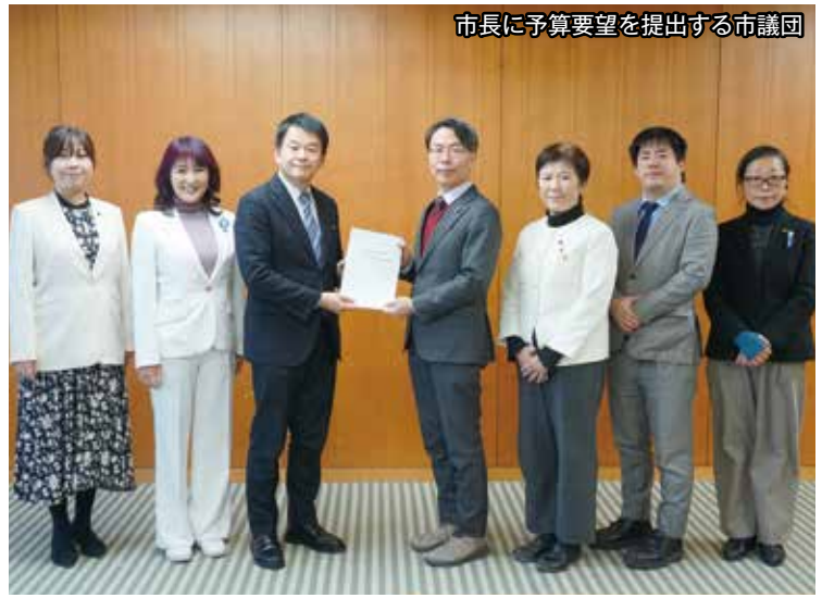
市長に予算要望を提出する市議団

2026年度のさいたま市予算は過去最大の規模となる1兆2000億円で、前年度比337億円増。市民の暮らしの厳しさが増すなか、暮らし最優先にこの大規模な予算を使うことが求められています。党市議団は予算組み替えを提案（下表）。基金の一部取り崩しや大規模事業の見直しなどで財源をつくり、地域経済支援、福祉・医療・教育・公共交通の充実で暮らしの安心を支えるとともに、社会保険料引き下げなど負担軽減を実現するよう求めました。また2031年完成予定の新市庁舎建設に約740億円もの事業費を予定し、38億円の基金積立をおこなう補正予算に反対しました。