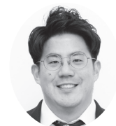
中央区 たけこし連