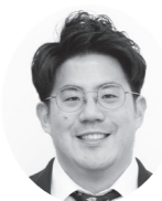
中央区 たけこし連