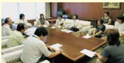
新日本婦人の会のみなさんと一緒に申し入れ = 2007年8月20日